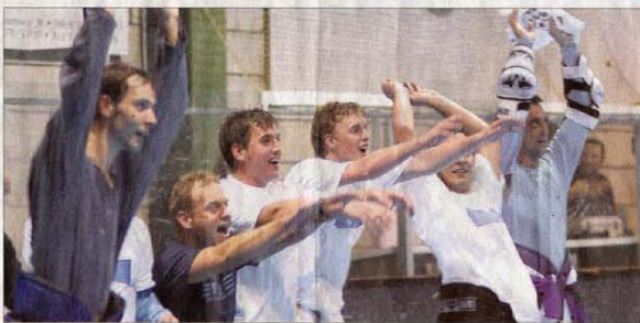
Die Meister-Spieler der Highlander zelebrierten im Zöpi-Drom die „Welle“ mit den Fans.